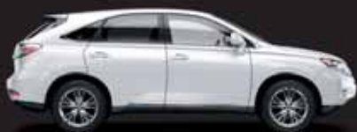
RX 450h Crossover Híbrido