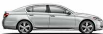
GS 300 / GS 460