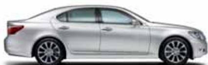
LS 460 / LS 460 AWD