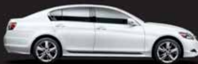
GS 450h Berlina híbrida de altas prestaciones