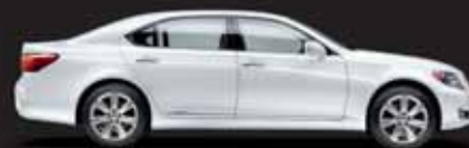
LS 600h / LS 600h L Berlina híbrida de altas prestaciones con tracción integral permanente